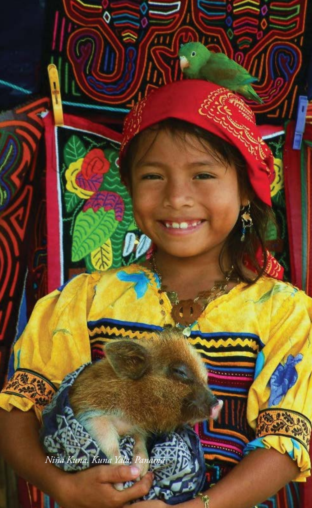
Niña Kuna. Kuna Yala, Panamá